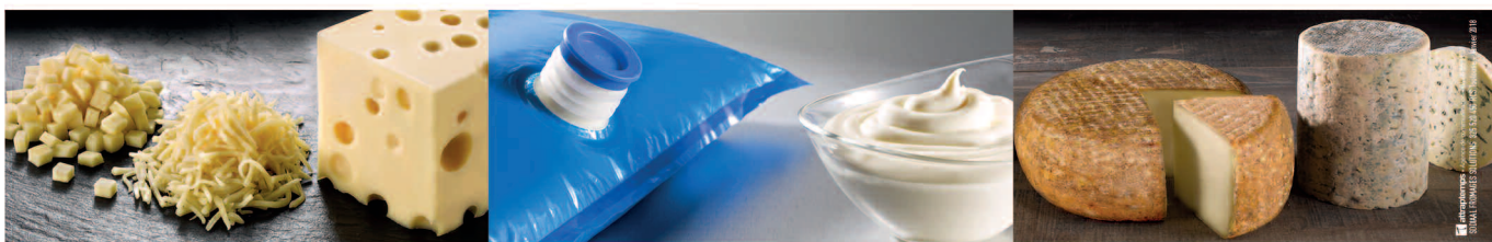
Une sélection de fromages qualitatifs parmi la plus large du marché

SODIAAL FROMAGES SOLUTIONS FROM FARMERS TO FOOD TRENDS